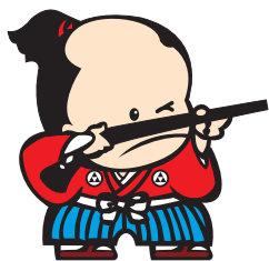
西之表市ご当地キャラクター ひなわ しゅうへえ 火縄 銃兵衛