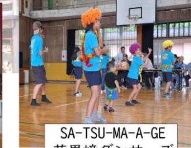
SA-TSU-MA-A-GE 花里崎ダンサーズ