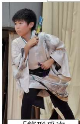
「銭形平次」 大河奏真さん