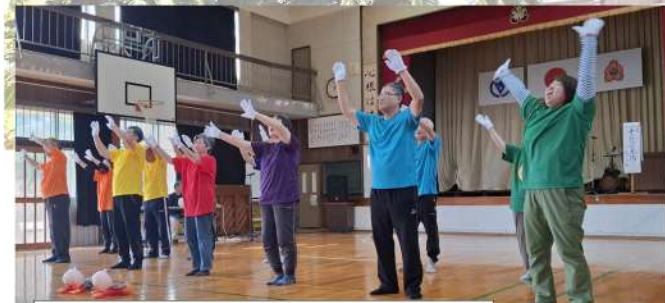
「手のひらを太陽に」 きぼう館