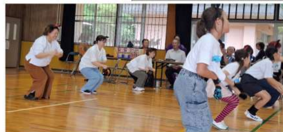
「ジャンポリミッキー」 大花里チーム

今年は小学生の相撲と綱引きのほか、これまでで最も多い13組が出場しました。「今年は例年になく、にぎわったなあ」と区長から喜びの声がこぼれました。