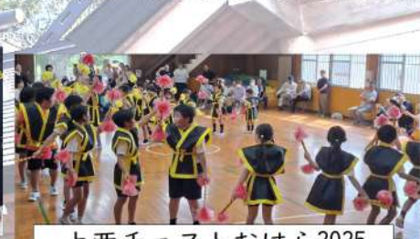
上西チェストおはら2025