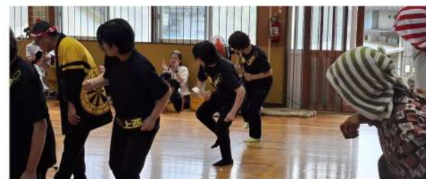
「おら 東京さ 出るだ」 池之久保婦人部青壮年