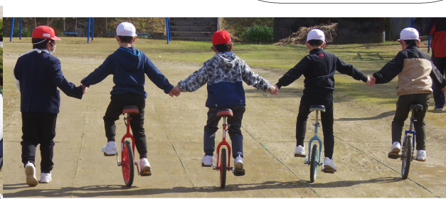
1・2年生 みんなで手をつなぎ…