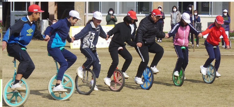
5・6年生オリジナルの技、「コンパス」

「持久走大会は自分とのたたかいでしたが、一輪車大会は団体で協力する競技です。」という開会式での教頭先生の言葉通りの大会になりました。チーム対抗リレーでも競走ではなく、30分間でチームが掲げた目標周回数をめざすのです。40周を目標にしたチームが残り半周のところカウントダウンが始まり、にわかに緊張感が…。残り3秒でみごとにゴール。あちこちで「バンザイ」の声が響きわたりました。