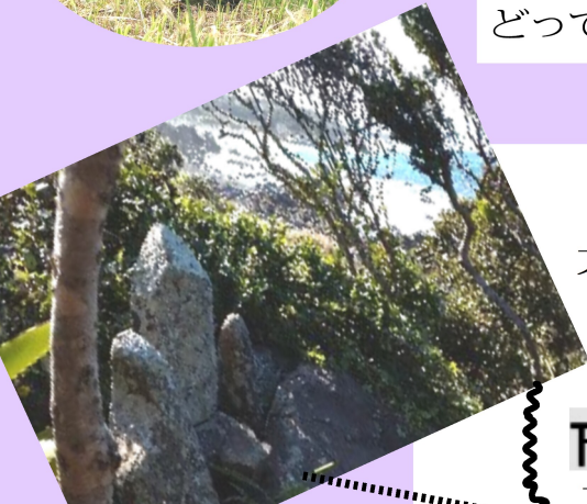
大広野神社下の海岸 火立の峯を正面に のぞむ場所で青田祭