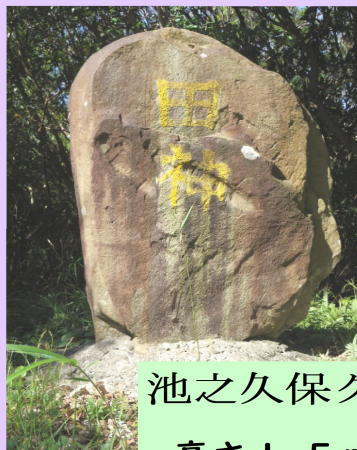
池之久保グランド 高さ1.5mほどの 石碑には「田神」と 書かれている。