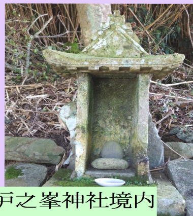
栢之峯神社境内 祠の中に祀られて いる田の神様