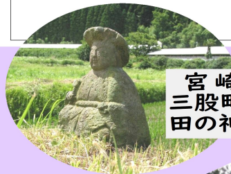
宮崎県 三股町の 田の神像