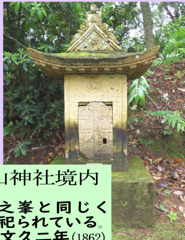
横山神社境内 栢之峯と同じく 祠に祀られている。 裏に文久二年(1862) と記されている。

塩屋神社を祀る大崎に田の神ではなく山の神信仰があるのは、塩焚きには薪が必要であり、山の安全を祈るためであろうとされています。