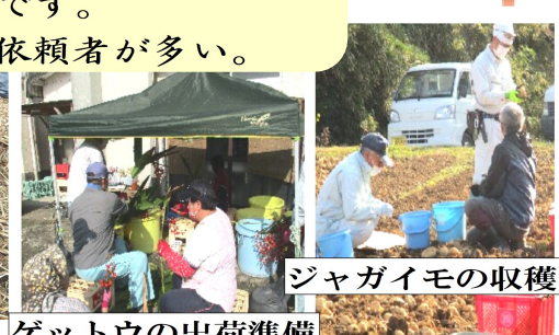
ゲットウの出荷準備