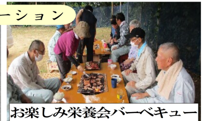
お楽しみ栄養会バーベキュー