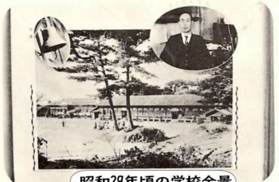
昭和29年頃の学校全景