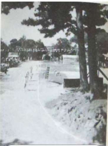
昭和45年校庭整地前の運動会と二本松