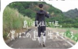
You Tuber Sさん→