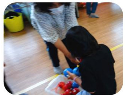
両手いっぱいボールを片付けようとけんめいな様子。

1ゲームが終わると、「もう一回」「またしたい」の声が子どもからも大人からも合唱のように室内にこだまして、2ゲームするなどとても盛り上がりました。