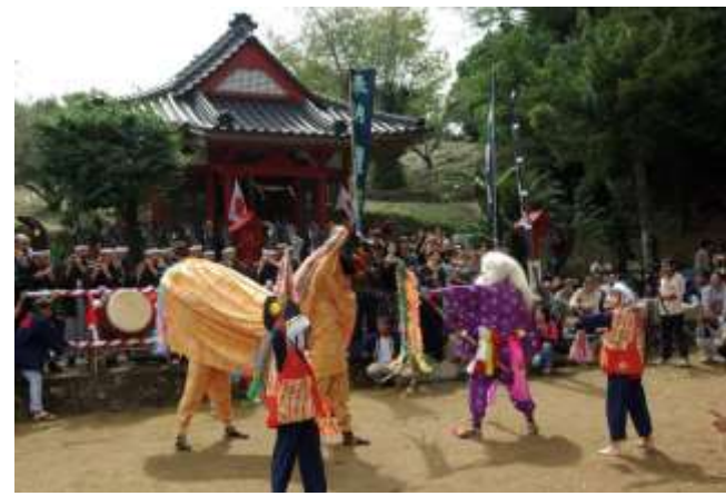
古田獅子舞(県指定文化財)