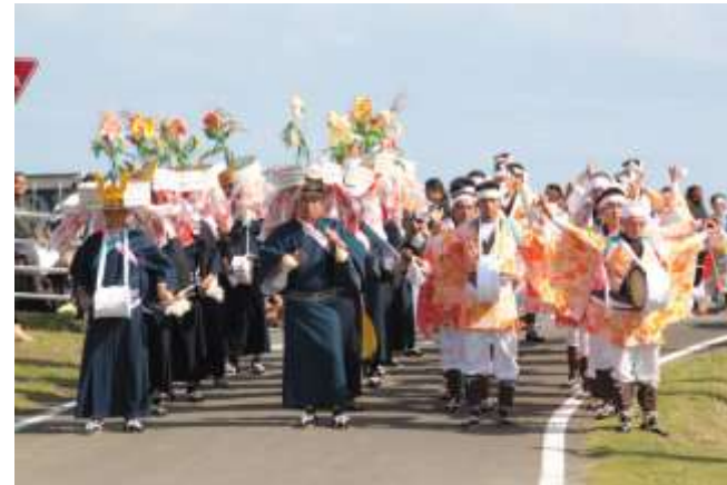
種子島大踊(県指定文化財)