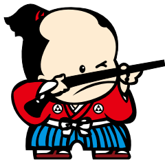
西之表市ご当地キャラクター ひなわ しゅうへえ 火縄 銃兵衛